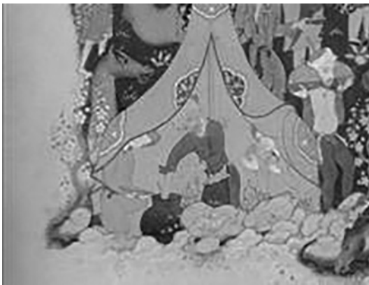
تصویر ۴. تقابل حاشیه و زمینه اصلی، بخشی از تصویر یک

در دوره اول عصر صفوی پیش از اینکه ورود مدرنیزاسیون و فاصله‌گیری زیاد از طبیعت، نهایی شود، توسل به واقع‌گرایی در هنر آنقدر زیاد نیست. در باب این مجموعه یعنی داستان لیلی و مجنون گفته شده جامی متأثر از نظامی و نیز امیرخسرو