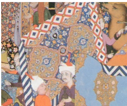
تصویر ۶. قرار گرفتن بخش اعظم یک چادر در قسمت‌های مهم تصویر، بخشی از تصویر یک.

بر دوش دارد؛ دست شخصیت دیگر و همچنین سر شخصی که بالای کادر است. عناصر و پیکره‌هایی که از متن اصلی بیرون زده‌اند، نیز به مثابه آرایه بکار می‌روند. هم به حاشیه تعلق دارند، یعنی مانند تزئینی بر بدنه اصلی نگاره بکار می‌روند و هم جزیی از تصویر اصلی هستند (تصویر ۵). واژه آرایه‌های اثر هنری برای ارجاع به چیزی استفاده شده که هم تزئینی است و هم زیبایی شکل را افزایش می‌دهد (کانت، ۱۳۹۳: ۱۳۰-۱۲۹). آرایه‌های اثر هنری شامل همه چیزهایی می‌شود که به اثر هنری پیوسته‌اند، اما جزیی از صورت یا معنی ذاتی نیستند: قاب نقاشی، سرستون قصر یا تزئینات پارچه‌ای روی تندیس‌ها که به عبارتی هم چارچوب اثر را می‌سازد و هم در عین حال آن را نفی می‌کند (آفرین، ۱۳۹۰: ۶۰)، آنها مرز بیرون و درون اثر را به هم می‌آمیزند.