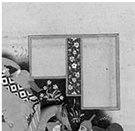
تصویر ۳. کادرهای مخصوص خوشنویسی، بخشی از اثر

مابه‌ازای تصویری بخشی از شعر روایی اورنگ ششم به نام لیلی و مجنون از کتاب هفت اورنگ جامی است. بنابراین، ارتباط مابه‌ازای تصویری با شعر در بررسی ادراک هنرمندان مولفه پراهمیتی به شمار می‌آید. افزون بر این، هر اثر هنری همواره در ارتباط و نسبت با سایر آثار بقا می‌یابد. در نتیجه کنش دیدن هنرمند نیز یک تجربه در ارتباط است، بدین معنی دیده‌ها و شنیده‌های هنرمند در نحوه ادراک و تصویرسازی وی نقش دارد. در این مورد برای درک عمیق‌تر این بحث، تبار این شعر و سپس فاصله شعر و تصویر بررسی می‌شود. این نگاره با بخشی مربوط به قیس عامری به عنوان شاعری در عصر جاهلیت در کتابی به نام الشعر و الشعرا از ابن قتیبه دینوری مربوط به ۲۷۶ ه. ق هم‌پوشانی معنایی دارد. بخشی از ترجمه شعر قیس از این قرار است: هنگامی دل به لیلی سپردم که خُرد و ساده‌دل بودیم [...] هر دو کودک بودیم و گوساله می‌چراندیم. ای کاش هرگز نه ما بزرگ شده بودیم و نه گوساله (موید، ۱۳۷۷: ۵۲۹)؛ همچنین این شعر با صورت صد سال بعد این حکایت در کتاب الاغانی به معنای ترانه‌های مسلمان‌های قرون اولیه، از ابوالفرج اصفهانی مربوط به قرن ۳ و ۴ هجری تبار مشترکی دارد (معصومی، ۱۳۸۹: ۱۷). یان ریپکا ۱ مستشرق چکی، ریشه این افسانه را متعلق به بابل باستان می‌داند. با توجه به الواح میخی کتابخانه بخت‌النصر داستان از این قرار است: کیس و لیلاکس هر دو سرنوشت متفاوتی داشتند به این دلیل که آن دو در معبد خورشید دلباخته هم شدند و برای