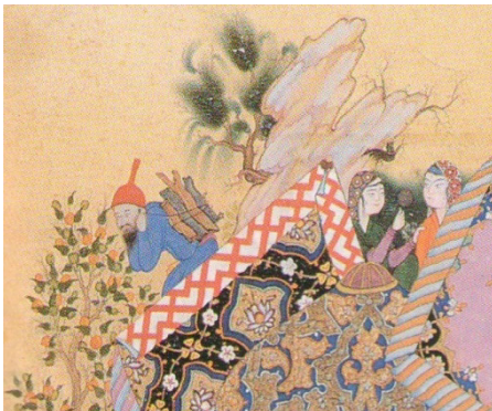
تصویر ۵. عناصر بیرون زده از محدوده تصویر که هم متعلق به تصویر و هم متعلق به حاشیه هستند، بخشی از تصویر یک

رنگ نخودی - کرم اطراف نقاشی هم می‌تواند کادر و بخش فرعی برای اثر در نظر گرفته شود؛ هم جز نقاشی و رنگ زمین و کوه و کمر به حساب آید. چندین عنصر آن را بخشی از اثر می‌گرداند: دو درخت که به صورت مجزا در آن قرار گرفته‌اند؛ فردی که با کوله‌باری از تنه‌های باریک درخت پایین می‌آید؛ فرد دیگری که مشک