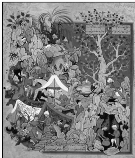
تصویر ۲. بیرون آوردن یوسف از چاه، برگي از هفت اورنگ جامی،

را غیر از عوامل شخصی رقم می‌زند؟ در دوره اول عصر صفوی، با اینکه در یک تلاش سیاسی گرایش‌های مذهبی با شدت و حدت زیادی دنبال می‌شود، ادراک نقاشان آن دوره چون شیخ محمد، میرزا علی فرزند سلطان محمد تبریزی، مظفر علی، آقا میرک (آژند، ۱۳۸۹: ۵۲۲) متأثر از عوامل دیگری فراتر از مذهب و گرایش‌های دینی است که این تحقیق در صدد یافتن آنهاست. نقاش احتمالی این اثر را شیخ محمد، دانسته‌اند که خود شاگرد بهزاد بوده و دارای آثاری آکنده از ویژگی‌های ظریف، عجیب و غریب با ترکیب‌بندی‌های پر زرق و برق، کشش مند و جذابیت‌های حاشیه‌ای و بیشتر توهم‌زا تا تصویری روایی (موسی و دیگران، ۱۳۷۷: ۲۷۰) خوانده شده است. بررسی عناصر فرمال و نشانه‌شناختی مجموعه، فاصله‌ای مشخص از قراردادهای مرسوم هنری پیشین را نشان می‌دهد که گاهی از سوی کارشناسان این حوزه به‌مثابه تحولی نامنسجم و غیرمنطقی می‌نماید. منطق و ویژگی‌های حاکم بر این نگاره کمابیش بر چندین نگاره دیگر از این مجموعه در گالری فریر چون بیرون آوردن یوسف از چاه (تصویر ۲) نیز جاری است. به انضمام اینکه در برخی نگاره‌های این مجموعه مانند نصحیت پدر به پسر در مورد عشق، پرسپکتیو به صورت ناقص اجرا شده است. بدین ترتیب ویژگی‌های تعدادی از نگاره‌ها بر بنیاد نگاره مورد خوانش، شکل گرفته و به دلیل مشابهت نسبی سبک آنها، تنها یک اثر بررسی شده است.