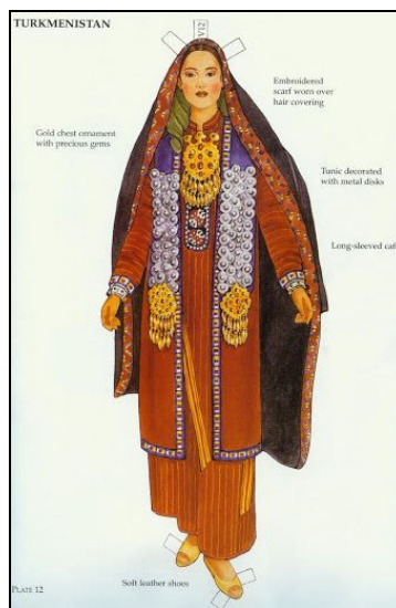
تصویر ۴. پوشاک زنان ترکمنستان

تزیین با جواهرات و بدلیجات هستند؛ آرایه‌هایی که حتی در لباس‌های معمولی روزمره زنان نیز کاربرد دارد. تزیینات غنی، پوشش سر، بخش اساسی پوشاک سنتی مردم ترکمنستان است. متناسب با سن و وضع تأهل، برخی از ویژگی‌های پوشاک زنان ترکمن، تغییر می‌کند. برای نمونه، چهار رنگ اصلی در پوشاک سنتی ترکمن‌ها عبارت‌اند از قرمز، سیاه، زرد و سفید و در این میان، لباس زنان، بیشتر قرمز رنگ است؛ اما هرچه سن زنان بالاتر می‌رود، زمینه رنگی لباس‌های رویی به رنگ‌های سیاه، زرد و سفید گرایش پیدا می‌کند. همچنین زنان متأهل جوان و دختران ترکمن، اغلب لباس‌هایی می‌پوشیدند که دست‌هایشان را تا مچ می‌پوشاند. لباس عروس نیز ویژگی‌های خاصی دارد. عروس در روز جشن عروسی لباسی پشمی متشکل از نوارهای «کیتنی» و طلایی با سوزن‌دوزی‌های ساده در دور گردن می‌پوشد. یک قبای تزیینی بلند که «شَبَت» نام دارد که بر روی این لباس پوشیده می‌شود و از «کیتن» قرمز تهیه شده است. ۱ در عین حال، جواهرات نقره‌ای و تزیینات سوزن‌دوزی، از عناصر جدایی‌ناپذیر لباس سنتی زنان ترکمنستان، در همه سنین محسوب می‌شود. تصویر ۴، نمایانگر نمونه‌ای از اصلی‌ترین تن‌پوش‌های سنتی زنان در ترکمنستان است. ۲