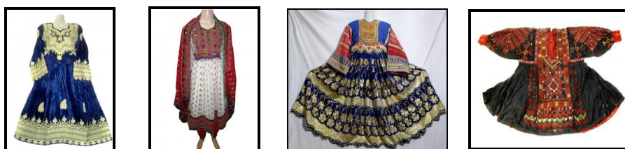
تصاویر ۳. پوشاک زنان افغان

آستین‌ها در میج و عرض شلوارها در قوزک و نیز بافته‌های پرنقش‌ونگار، جنس تارو پود و انواع تزیینات، موضوعات بسیار مهمی از دید زنان محسوب می‌شود» (دوپری در بلوکباشی، ۱۳۸۲: ۲۵۱). تزیینات در پوشاک زنان افغان اهمیت بسیاری دارد. اشیای تزیینی که روی لباس‌های زنان افغان دوخته می‌شود را می‌توان از مهم‌ترین اجزای لباس‌های آنان دانست. «مقدار زیادی منجوق، پولک، سکه، دگمه و سگک و طلسم‌های (تعویذ) نقره‌ای، روی لباس‌ها دوخته می‌شود. در میان بعضی چادرنشینان، به ویژه پشتون‌های شرقی، این زینت‌آلات نقره‌ای به نوعی با آینه‌کاری، تارها و نوارهای زر و نقره و منجوق‌های بسیار باشکوه، به اضافه حاشیه‌دوزی ظریفی همراه است» (دوپری در بلوکباشی، ۱۳۸۲: ۲۵۲). تصاویر ۳ نمونه‌هایی از پوشاک سنتی زنان افغان را نشان می‌دهد. ۱