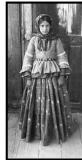
پوشاک دختر آذربایجانی اهل شوشی یا شوشا، ۱۸۹۸ - چادر دختر جوان اهل شاماخی، ۱۸۸۳. تصاویر ۲. پوشاک زنان آذربایجان