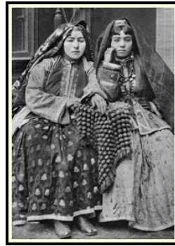
پوشش زنان جوان، باکو، ۱۸۸۱ - پوشش زن جوان، باکو، ۱۸۸۳