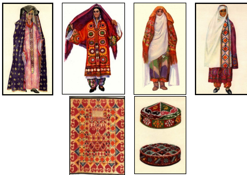
تصاویر ۱. پوشاک زنان تاجیکستان

«سرپوش‌ها»، از اجزای مهم لباس زنان تاجیک محسوب می‌شوند. برای نمونه روسری بزرگی که روی سر قرار می‌گیرد در مناطق مختلف، تنوع می‌یابد: «نوعی که در دشت پوشیده می‌شود (سمرقند، بخارا، خجند)، به شکل مربع یا مستطیل بزرگی است، در حالی که در کوهستان (کولاب، درواز) بیشتر به شالی با لبه‌های حاشیه‌دوزی شده شباهت دارد» (مایتد ینوا در بلوکباشی، ۱۳۸۲: ۲۶۴). تصاویر ۱، نمونه‌هایی از سرپوش‌های زنان تاجیک را نشان می‌دهد. ۱