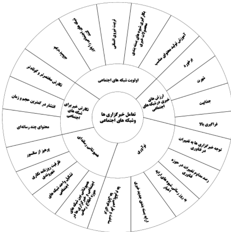
نمودار ۱. پنج عامل مهم در همگرایی رسانه‌ای

اجتماعی در چهار حوزه اولویت شبکه‌های اجتماعی، هم‌پوشانی رسانه‌ای، ارزش‌های خبری در شبکه‌های اجتماعی و نگارش خبر برای شبکه‌های اجتماعی تبیین شده است. در دایره اول، زیرمجموعه‌های الزامات همگرایی رسانه (شامل اولویت شبکه‌های اجتماعی، نگارش خبر برای شبکه‌های اجتماعی، ارزش‌های خبری در شبکه‌های اجتماعی، هم‌پوشانی رسانه‌ای و نوآوری) و در دایره دوم الزامات آن‌ها مشخص شده‌اند؛ مثلاً برای الزامات ارزش‌های خبری رعایت برخورد، شهرت، جذابیت و فراگیری زیاد الزامی است. نتایج پژوهش با نظر دال زتو و لوگمایر همسوست. به باور آنان، همگرایی باعث کاهش هزینه‌های عملیاتی شده است که این امر بر کیفیت محصولات رسانه‌ای تأثیر منفی داشته است. اما صرف نظر از چنین انتقادهایی، همگرایی رسانه‌ای واقعی‌تری انکارناپذیر در تحولات رسانه‌ای دوران معاصر است.