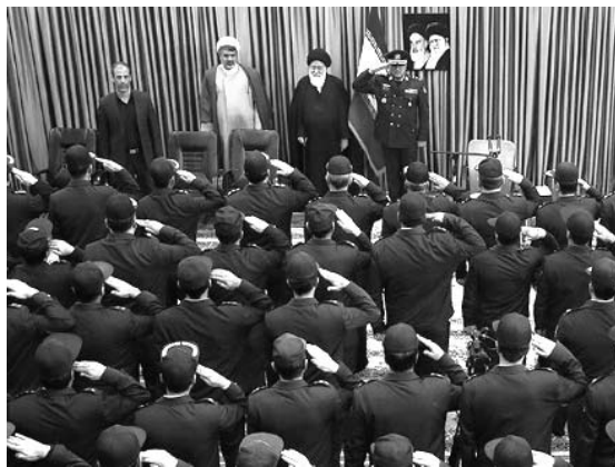
تصویر ۳. دیدار جمعی از فرماندهان نیروی هوایی ارتش ایران با سید احمد علم‌الهدی، امام جمعه مشهد

یکی دیگر از راه‌های انتشار محتوای دست‌کاری شده مبتنی بر تصاویر برداشت‌های اشتباه از تصاویر است. این موضوع به‌ویژه در رسانه‌های اجتماعی، که معمولاً تصاویر به همراه کپشن منتشر می‌شوند، شایع است. مثلاً صبح روز ۱۸ بهمن ۱۳۹۷ جمعی از فرماندهان نیروی هوایی ارتش، هم‌زمان با روز نیروی هوایی ایران، با سید احمد علم‌الهدی، نماینده رهبر انقلاب اسلامی در خراسان رضوی و امام جمعه مشهد، دیدار کردند. انتشار تصویری (تصویر ۳) از این دیدار در فضای مجازی سبب شایعاتی مبنی بر این شد که فرماندهان ارتش شمال شرق کشور به آیت‌الله علم‌الهدی سلام نظامی داده‌اند (تسنیم، ۱۳۹۷/۱۱/۲۰). این موضوع با واکنش‌های متعددی از سوی شخصیت‌های سیاسی و فعالان شبکه‌های اجتماعی روبه‌رو شد. چند روز بعد و با توضیحات حجت‌الاسلام علم‌الهدی مشخص شد احترام نظامی یادشده به دلیل پخش سرود ملی ایران و احترام به فرمانده حاضر در جایگاه بوده است نه ایشان.