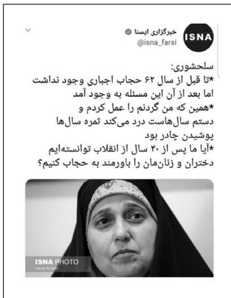
تصویر ۱. توییت منتشرشده در صفحه خبرگزاری ایسنا درباره صحبت‌های پروانه سلحشوری

دست‌کاری در متن از رایج‌ترین شیوه‌های مورد استفاده در خبر جعلی است. تولیدکنندگان خبر جعلی با استفاده از اطلاعات ناقص یا تحریف اطلاعات اقدام به تولید خبر جعلی می‌کنند. این موضوع می‌تواند از طریق دست‌کاری در متن یک سخنرانی یا یک مصاحبه یا انتشار سلیقه‌ای جزئی از یک کل اتفاق بیفتد. دقت کنید که در سخنرانی‌ها یا صحبت‌های طولانی‌تر، ممکن است جملات خاصی برای تکمیل بحث مطرح شود که انتشار آن جملات به تنهایی موجب بروز سوء برداشت شود. مثلاً، یکی از این دست‌کاری‌ها در ماجرای مناظره آذرماه ۱۳۹۷ پروانه سلحشوری، نماینده تهران در مجلس ایران، با فرشته روح‌افزا، از استادان دانشگاه شهید بهشتی تهران، رخ داد. در پایان این مناظره که با موضوع «پوشش و حجاب» برگزار شده بود، خبرگزاری رسمی ایسنا یک قطعه خبری را به نقل از این نماینده مجلس در قالب توییتی منتشر کرد (تصویر ۱).