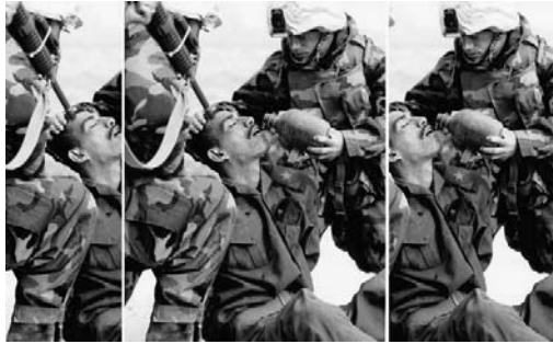
تصویر ۲. ایجاد دو روایت متضاد با برش‌های مختلف از یک تصویر

یکی دیگر از راه‌های انتشار محتوای دست‌کاری شده مبتنی بر تصاویر برداشت‌های اشتباه از تصاویر است. این موضوع به‌ویژه در رسانه‌های اجتماعی، که معمولاً تصاویر به همراه کپشن منتشر می‌شوند، شایع است. مثلاً صبح روز ۱۸ بهمن ۱۳۹۷ جمعی از فرماندهان نیروی هوایی ارتش، هم‌زمان با روز نیروی هوایی ایران، با سید احمد علم‌الهدی، نماینده رهبر انقلاب اسلامی در خراسان رضوی و امام جمعه مشهد، دیدار کردند. انتشار تصویری (تصویر ۳) از این دیدار در فضای مجازی سبب شایعاتی مبنی بر این شد که فرماندهان ارتش شمال شرق کشور به آیت‌الله علم‌الهدی سلام نظامی داده‌اند (تسنیم، ۱۳۹۷/۱۱/۲۰). این موضوع با واکنش‌های متعددی از سوی شخصیت‌های سیاسی و فعالان شبکه‌های اجتماعی روبه‌رو شد. چند روز بعد و با توضیحات حجت‌الاسلام علم‌الهدی مشخص شد احترام نظامی یادشده به دلیل پخش سرود ملی ایران و احترام به فرمانده حاضر در جایگاه بوده است نه ایشان.