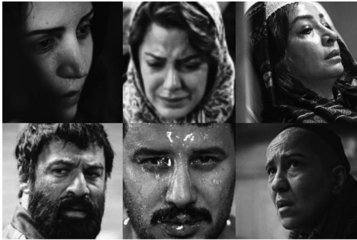
شکل ۲. فیلم سینمایی شنای پروانه