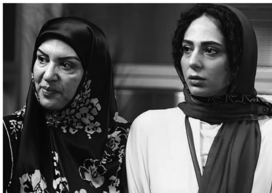
تصویر ۱. فیلم سینمایی خانه دختر