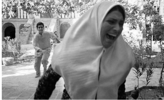
شکل ۲. فیلم سینمایی خانه پدری

ملوک دختر جوان یک خانواده سنتی است که به دلایل ناموسی، پدرش کلبحسن خواهان مرگ او است و برای اینکار به پسر کوچکش به نام محتشم گفته تا قبری در زیرزمین حفر کند تا برای پاک کردن ننگ و حفظ آبروی خانواده، ملوک را دور از چشم مادر و خواهرانش کشته و در آنجا دفن کنند.