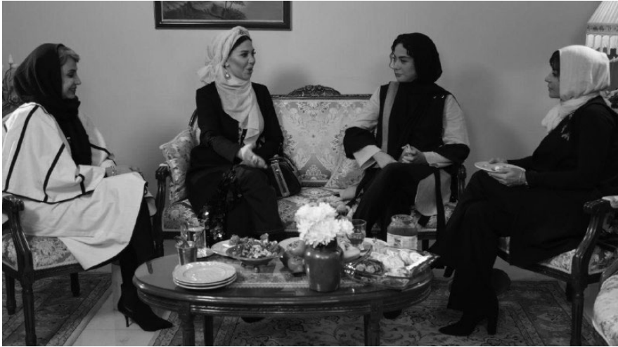
تصویر ۱. نمونه‌ای از تجلی تم در پوشش سلبریتی‌ها، تم زرد و مشکی، قسمت اول از فصل دوم

مدل مو و آرایش: مدل مو، آرایش و گریم سر و صورت، خال کوبی و خال مصنوعی از جمله مواردی بودند که درخصوص این مؤلفه در نظر گرفته شدند. تغییر مدل مو و آرایش متناسب با تم، چه در مورد زنان و چه مردان، بیشتر در تم‌هایی که ظرفیت نمایشی داشته‌اند بروز یافته است. تم لاتی برای مردان و تم قاجار برای زنان از این دست‌اند.