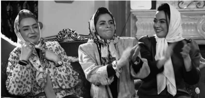
تصویر ۸. نمونه‌ای از تجلی تم در رفتار سلبریتی، تم دهه شصت، قسمت سوم از فصل دوم

رفتار: در این بخش رفتارهای ظاهری سلبریتی‌ها و حتی زبان گفتار و لحن آن‌ها مد نظر بوده است. در ۱۱ مورد رفتارها متأثر از تم بوده و به نوعی آن را بروز داده‌اند. غالب این رفتارها در لحظات نمایشی برنامه اتفاق افتاده‌اند. مدل دست‌زدن به شیوه گذشته در تم دهه شصت و ادای جملات گیلکی در تم مربوطه از سوی سه سلبریتی گیلک شرکت‌کننده نمونه‌ای از این رفتارهاست.