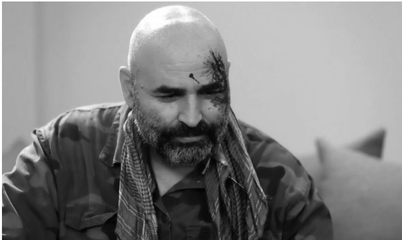
تصویر ۲. نمونه‌ای از تجلی تم در گریم سلبریتی، تم لاتی (جاهلی)، قسمت اول از فصل پنجم

مدل مو و آرایش: مدل مو، آرایش و گریم سر و صورت، خال کوبی و خال مصنوعی از جمله مواردی بودند که درخصوص این مؤلفه در نظر گرفته شدند. تغییر مدل مو و آرایش متناسب با تم، چه در مورد زنان و چه مردان، بیشتر در تم‌هایی که ظرفیت نمایشی داشته‌اند بروز یافته است. تم لاتی برای مردان و تم قاجار برای زنان از این دست‌اند.