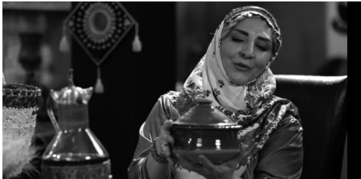
تصویر ۵. نمونه‌ای از تجلی تم در هدیه سلبریتی‌ها، تم گیلکی، قسمت سوم از فصل چهارم

هدیه‌ها: یکی از رسوم به‌نمایش درآمده در بسیاری از قسمت‌های این برنامه هدیه‌دادن مهمانان به میزبان و میزبان به مهمانان بوده است. هر دوی این موارد در بررسی‌ها مورد نظر بوده‌اند. یافته‌ها نشان می‌دهد که در ۱۱ مورد هدایا انعکاس‌دهنده تم مهمانی بوده‌اند.