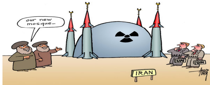
نمونه ۲. ایران و آژانس بین‌المللی انرژی اتمی، آرنند ون دام، ۷ نوامبر ۲۰۱۱

جدید هسته‌ای ادامه می‌دهد. اکنون مخالفت آن با کشوری که سلاح هسته‌ای ندارد و در صدد استفاده صلح‌آمیز از انرژی هسته‌ای است، ریشه در اسطوره غربی «ما» در مقابل «آنها» دارد و این اسطوره در آمریکا نسبت به جاهای دیگر بیشتر مشهود است. همچنین در راستای سرمایه‌داری جهانی و منافع غربی در انرژی به‌ویژه در خاورمیانه است. در گفتمان این کارتون، غرب در مقابل ایران اسلامی، تعیین‌کننده تمایز میان «ما (خود)» و «آنها (دیگری)» است. همان‌طور که مطرح شد، مسئله انرژی هسته‌ای ایران مسئله جهانی است اما بیشترین تأکید در این کارتون، تمایز بین ایران اسلامی (به‌منزله آنها و دیگری) و آمریکا (به‌منزله ما و خود) است. دولت ایران به‌دلیل اینکه اسلامی است، غیرقابل اعتماد است و تلاش‌های دیپلماتیک روسیه و چین برای مهار ایران در دسترسی به بمب هسته‌ای امتیاز دادن به کشوری است که اسلامی بوده و اسلام یک تهدید است. این اساس عقیدتی و اسطوره غربی ما در مقابل آنها در این کارتون است. در حقیقت، اختلاف با جهان اسلام و در نتیجه ایران، نیاز درونی جامعه غربی برای تهدید و در عین حال غلبه و سلطه بر دیگری است.