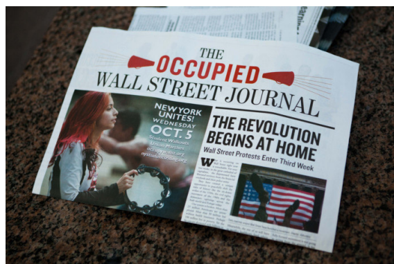
تصویر ۵. نمونه‌ای از روزنامه‌های چاپ شده توسط فعالان جنبش اشغال وال‌استریت