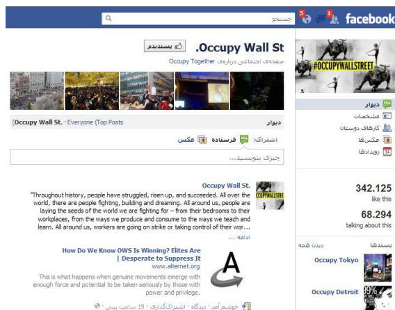
تصویر ۴. بزرگ‌ترین صفحه حامیان فیس‌بوکی جنبش وال استریت

در اول اکتبر «بوستون را اشغال کنید» در توئیتر نمایان شد؛ پس از ۲ هفته «دنور را اشغال کنید» و «داکوتای جنوبی را اشغال کنید» و ... در صفحه اینترنت ظاهر شدند (همان). صفحه «وال استریت را اشغال کنید» فیس‌بوک (تصویر ۴) نیز در ۱۹ سپتامبر به همراه فیلم‌های معترضان اولیه در یوتیوب به عرصه اینترنت پا گذاشت. این صفحه هم‌اکنون بیش از ۳۴۰ هزار عضو دارد که از این میان تنها حدود ۷۰ هزار نفر در گفتگوها فعال هستند. از سوی دیگر علاوه بر آمریکا اکنون صفحات فیس‌بوک برای اشغال کشورها یا شهرهایی از کشورهای کانادا، دانمارک، پرتغال، ایتالیا، بریتانیا، سوئد، فرانسه، آلمان، اسپانیا، کلمبیا، استرالیا و... نیز راه‌اندازی شده است.