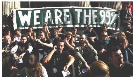
تصویر ۱. شعار اصلی فعالان جنبش اشغال وال‌استریت

«والاستریت را اشغال کن» را یک جنبش اجتماعی نام‌گذاری کرد (dcourier, 2011).