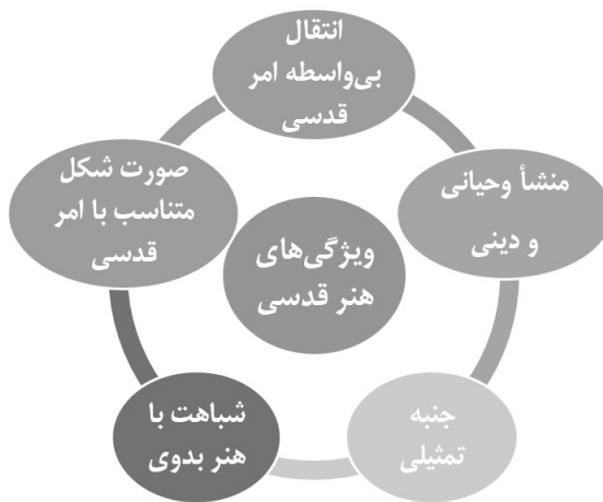
نمودار ۰۱. ویژگی های هنر قدسی

نیز اینگونه بود «هنر قدسی، غالباً با تکنیک های بدوی، دو بعدی بودن تصویر، مقابل نگری، خطوط انتزاعی و شخصیت های متعالی است که درصدد بیان مفاهیم قدسی بر می آید» (ماریتن به نقل از نوروزی، ۱۳۹۷: وبسایت حوزه هنری قم) در حقیقت توجه به امر قدسی و الوهیت به عنوان مفاهیم معنوی و مجرد که در حالت سکون اند باعث شده تا هنر بدوی، سنتی و قدسی نیز دارای سکون و خالی از حرکت باشد و این به عنوان یکی از ویژگی های بارز آن‌ها لحاظ شود.