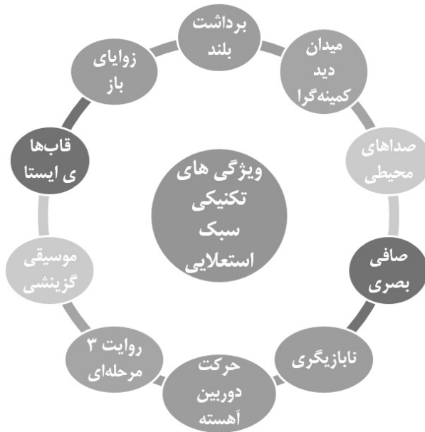
نمودار ۲. ویژگی‌های تکنیکی سبک استعلایی

سوزان سانتاگ منتقد سینما استفاده از نابازیگران را برای بیان بهتر سبک استعلایی و معنوی یکی از خصوصیات مهم می‌داند. این شگرد باعث می‌شود تا مخاطب کمتر درگیر بازیگر شود و با او همذات‌پنداری نکند تا مضمون مقدس و معنوی بهتر در وجود او اثر بگذارد. سانتاگ حتی معتقد است که کارگردانی مانند برسون (که شریدر در کتابش نیز او را یکی از سه کارگردان موفق در سبک استعلایی معرفی می‌کند) این رویکرد را به خود بازیگران هم می‌گفت تا از همذات‌پنداری با نقش دست بردارند؛ حتی «خواست او از بازیگران این بود که جملات خود را بیان نکنند، بلکه صرفاً آنها را بر زبان بیاورند و تا حد امکان بدون کمترین بارقه‌ای از بیانگری. در این صورت غلیان‌های عاطفی به صورت فرعی به ظهور می‌رسند» (سانتاگ، ۱۳۷۸: ۱۹۵) باور سانتاگ این است که برسون و دیگر فیلمسازان سبک استعلایی سینما را فی حد ذاته واجد نوعی خلوص و زلالی می‌دانند که می‌تواند در بیان امر مقدس و متعال موفق باشد به شرط آنکه عوامل بازدارنده و مزاحم چون بازیگران مشهور یا دیگر ابزارها و مصالح مادی و رایج در فیلم به کار گرفته نشود (Sontag, 1997).