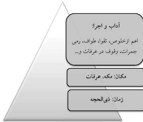
شکل ۱. عناصر هویتی مناسک

حج، همانند سایر مناسک دینی، آداب، سنن و فرایضی خاص و زمان و مکانی دارد که برای تحصیل صفات ثبوتی و اجتناب از آراستن به اوصاف سلبی است. انسان در مقام خلیفه‌اللهی و اظهار در صفات جمال و جلال، دارای صفات ثبوتی و سلبی است. از این رو موظف است که به تهذیب و تزکیه پردازد؛ بدین صورت که ابتدا خود را از رذایل اخلاقی پاک و سپس به فضایل اخلاقی بپیوندد و مظهر اوصاف الهی گردد؛ بنابراین، حج بهترین فرصت برای تأمین این هدف است؛ زیرا باطن و هدف این منسک برای تهذیب نفس است (جوادی آملی، ۱۳۸۸). بطون محرّمات حج برای شرک زدایی از انسانی است که گرفتار عصیان و تباهی می‌شود. آیه شریفه «فَلَا رَفَتْ وَلَا فُسُوقَ وَلَا جِدَالَ فِي الْحَجِّ» (۴۱) به سه مورد از محرّمات حج که هر یک در تطهیر یکی از قوای نفسانی (قوه شهویه، قوه غضب و تهذیب قوای فکری) نقش دارد، اشاره می‌کند؛ بنابراین با طهارت این قوای سه‌گانه امور انسانی پاک می‌شود؛ زیرا صدور هر کاری از انسان با تحلیل به یکی از سه قوه مذکور برمی‌گردد. لذا سه‌گان هویتی حج که هر ساله به صورت همسان و یکسان برگزار شده تا هویت فرهنگی- دینی درک و وجوه امتیاز آن را در مقایسه با سایر فرهنگ‌ها تبیین شود. خداوند در این سوره و سایر سوره نظام دینی- توحیدی جاهلیت را به اوصافی مانند کفر، شرک، گمان باطل و افترا بر خدا، تکذیب رسولان الهی و انکار معاد، ترسیم نموده است. در ادامه به بررسی این مهم خواهیم پرداخت.