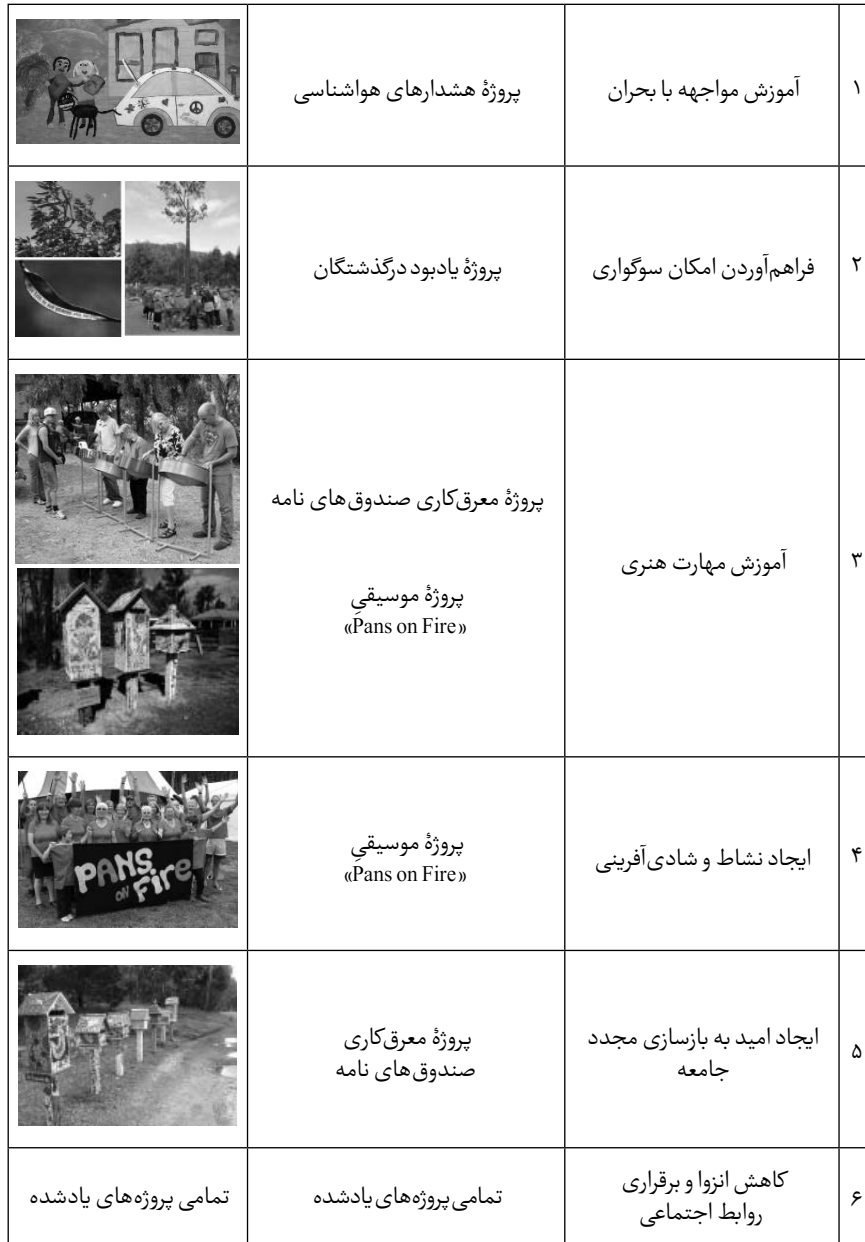
جدول ۴. دسته‌بندی پروژه‌ها به تفکیک هدف

این پروژه‌ها، با توجه به هدف و در پاسخ به نیازهای روان‌شناختی پس از بحران، به تفکیک در جدول ۴ نشان داده شده‌اند.