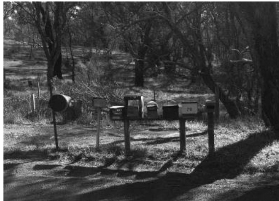
تصویر ۲. صندوق‌های نامه معمولی در شهر استراتون پیش از پروژه اوکلی ۴

پروژه «صندوق‌های نامه موزاییکی در شهر استراتون» ۱ در ویکتوریای استرالیا اجرا شد. در این پروژه، ۳۰ زن محلی برای ساکنان‌ی که خانه‌هایشان در آتش‌سوزی شنبه سیاه ویران شده بود صندوق‌های نامه موزاییکی ساختند و محل ساخت خانه‌های جدید در شهر با این صندوق‌های زیبا و آثار هنری مشخص شد. این پروژه آگوست ۲۰۱۰ (سه ماه پس از آتش‌سوزی‌های ۷ فوریه ۲۰۰۹ که باعث نابودی شهر استراتون شد) آغاز شد. در این حادثه ۸۰ خانه ویران شد. پس از این حادثه، ماریون اوکلی ۲ ، هنرمند موزاییک ۳ از اهالی استراتون، این امکان را فراهم کرد تا مردم شهر به بهانه ساخت این آثار هنری دور هم جمع شوند، با یکدیگر صحبت کنند، در کنار هم سوگواری کنند و حین ساخت صندوق‌های نامه جدید و یادگیری مهارت هنری استفاده از موزاییک معرق به تعامل بپردازند. به گفته اوکلی، صندوق‌های نامه موجود در این منطقه (تصویر ۲) جعبه‌هایی بی‌رنگ و معمولی بودند که او در راه ورود به استراتون از آن‌ها عکس گرفته بود. زمانی که اوکلی برای عکاسی از این صندوق‌های نامه توقف کرده بود، با دیدن این صحنه افسرده‌کننده، ایده ساخت صندوق‌های نامه جدید در ذهنش شکل گرفت (Fisher, 2019).