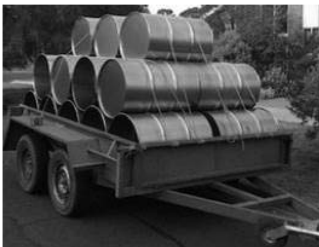
تصویر ۴. تصویری از بشکه‌های اهدایی شرکت محلی برای تهیه سازها

تهیه تعداد ساز کافی برای اجرا بود. این گروه، برای اجرای پروژه، ابتدا به دنبال سازهای دست دوم بودند، اما وقتی موفقیتی کسب نکردند، سرانجام تصمیم گرفتند که خودشان با استفاده از بشکه‌های صنعتی سازهای جدید بسازند. وقتی هدف پروژه خود را که کمک به آسیب دیدگان آتش سوزی بود، برای مؤسسه بسته بندی VIP (یکی از مؤسسات محلی) توضیح دادند، آن‌ها با اشتیاق کمک کردند و کارگران آن مؤسسات نیز داوطلبانه همراه شدند و در نهایت، یک دسته بشکه را که از هر دو انتها بسته بود و امکان ساخت دو درام از هر بشکه را می داد بدون هیچ هزینه‌ای به این گروه هدیه دادند. (تصویر ۴)