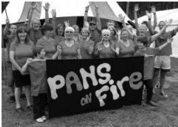
مقایسه تصاویر ۱ و ۵. تأثیر فعالیت گروه موسیقی بر روحیه ساکنان محلی