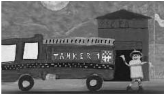
تصویر ۹. استفاده از قابلیت نشاط‌آفرینی هنر در انتقال مفاهیم آموزشی در مواجهه با بحران

تصویر سمت چپ ضرورت ترک محل و تخلیه‌ی شهر در هنگام احتمال آتش‌سوزی را (که در حالت عادی، واقعه‌ای به شدت اضطراب‌آور است) در قالب یک نقاشی شاد با چهره‌هایی خندان نشان می‌دهد که موجب کاهش استرس کودکان می‌شود. در تصویر سمت راست، چهره‌ی