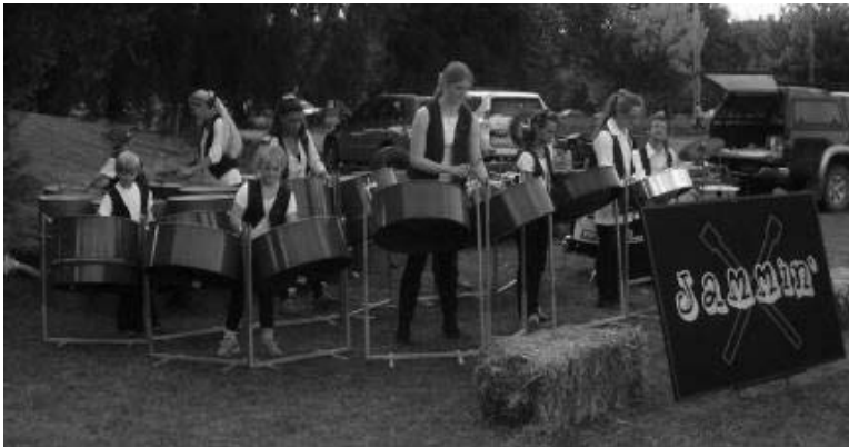
تصویر ۶. اجرای گروه «مادران و فرزندان» ۳

آغاز کار، گروه موسیقی «مادران و فرزندان» بخشی از این برنامه بود. این گروه نیز سال ۲۰۱۱ تحت عنوان «Jammin» (تصویر ۶) انسجام بیشتری یافت و اولین کنسرت آنان در جشنواره «کارت ویلز» ۱ در الکساندرا در اکتبر ۲۰۱۱ بود. ۲