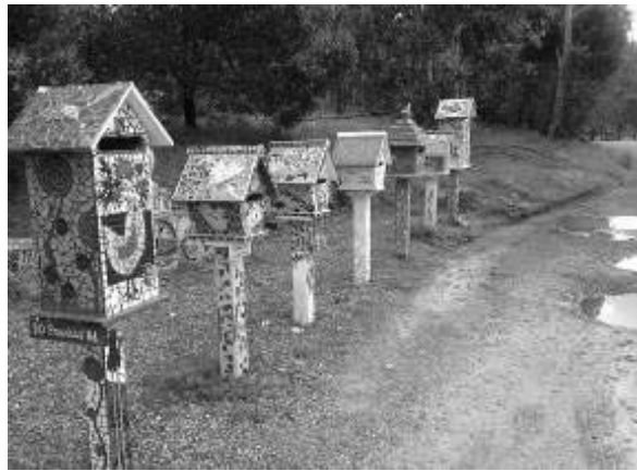
مقایسه تصاویر ۲ و ۳. صندوق‌های نامه در شهر استراتون بیش و پس از پروژه معرق‌کاری