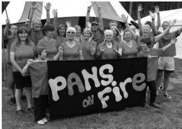
تصویر ۵. اجرای اولیه گروه برای ساکنان محلی ۱

با ادامه یافتن فعالیت‌های گروه و با افزایش علاقه‌مندان به عضویت در گروه موسیقی، اوایل سال ۲۰۱۱، لیست انتظاری از افرادی که مشتاق پیوستن به گروه بودند شکل گرفت؛ بنابراین، گروه دیگری نیز تحت عنوان «Hot Pans» شکل گرفت و کار آموزش گروه جدید دوباره از ابتدا آغاز شد. این بار نیز، بیشتر اعضا افرادی غیرحرفه‌ای در موسیقی بودند که از منطقه آتش‌سوزی آمده بودند. پس از هشت ماه تمرین، اولین اجرای آن‌ها به‌عنوان بخشی از اجرای «گروه بزرگ» در شب کالیپسو ۲ اکتبر ۲۰۱۱ برگزار شد. همچنین «از همان روزهای نخستین