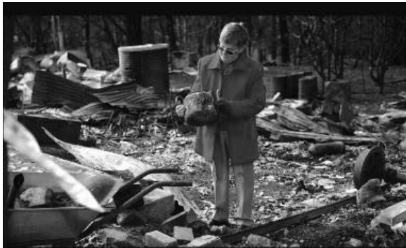
تصویر ۱. سمت راست: نقشه مناطق آسیب‌دیده و تعداد تلفات ۳ سمت چپ: تصویری از شهر مریسویل پس از آتش‌سوزی ۴

این حادثه، ضمن به بار آوردن خسارات مالی و جانی گسترده، تأثیرات فراوان و طولانی‌مدتی بر روحیه و سلامت روانی افراد ساکن در مناطق آسیب‌دیده گذاشت. در مواجهه با تبعات عاطفی و روانی این حادثه، پروژه‌های هنری مختلفی به منظور ترمیم روحیه قربانیان حادثه و بازگرداندن