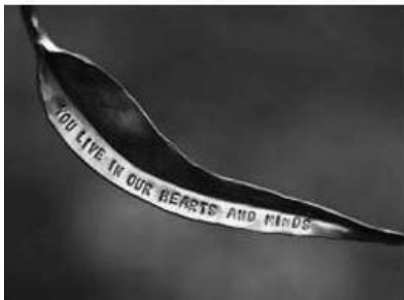
تصویر ۷. بنای یادبود درخت آهنگران ۳

پارک یادبود درگذشتگان: «علاوه بر درخت یادشده، یک پارک یادبود نیز برای بزرگداشت ۲۳ تن از قربانیان آتش‌سوزی ۲۰۰۹ استراتون ساخته شد.» (Lisa, 2014) در یادمانی که در میان