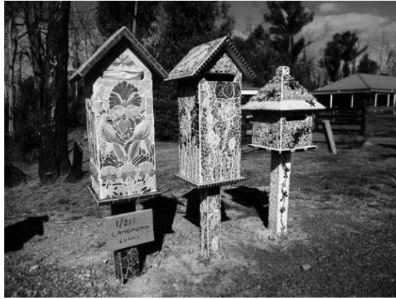
تصویر ۳. منظره رنگین ایجادشده با صندوق‌های نامه جدید در شهر استراتون ۱

درواقع، این گروه از خانواده‌های آسیب‌دیده از بحران آتش‌سوزی، با نصب و علامت‌گذاری محل ساخت خانه‌های جدید در شهر، به‌گونه‌ای نمادین خانه‌های خود را دوباره ساختند و از طریق برقراری تعاملی سازنده در جلسات هنری، موفق شدند مجدداً به جامعه بازگردند.