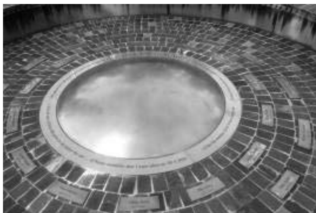
تصویر ۸. پارک یادبود قربانیان در استراتون ۱

دیوار یادبود درگذشتگان: در منطقهٔ ردسديل ۲ ویکتوریا، یک هنرمند موزاییکی با همراهی ساکنان محلی اقدام به ساخت دیوار یادبود کرد. «طول این دیوار ۱۱ متر است و با استفاده از اجسام و اشیای خانه‌هایی ساخته شد که در آتش‌سوزی شنبهٔ سیاه از بین رفته یا آسیب دیده بودند. این دیوار که برای احترام و همدلی با کسانی که جان یا دارایی خود را در این واقعه از دست داده بودند ساخته شد، امروزه به بنای یادبود محلی برای جامعه تبدیل شده است.» (Fisher, 2019)