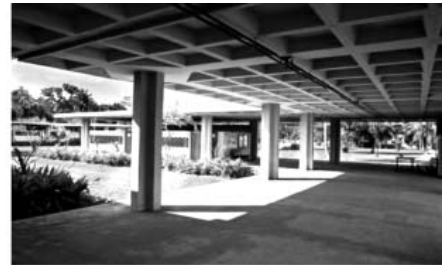
شکل ۴. بنیاد جهانی مسنرو اورتندر در سریلانکا