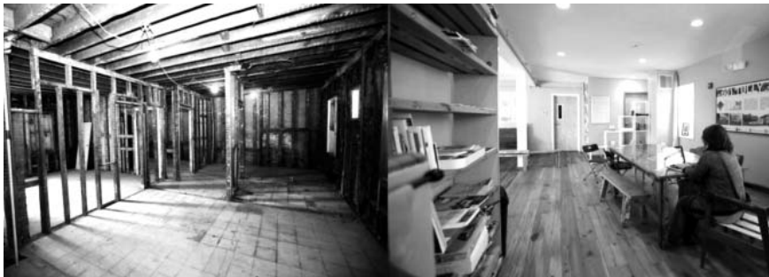
شکل ۵. پروژه «خیابان ۶۰۱»

ویلسون ۱ ، که بیشتر به عنوان هنرمند محیط زیستی ۲ شناخته شده است، هسته مرکزی آثار هنری خود را پیوند انسان‌ها با نژادهای گوناگون می‌داند. او درسی میان رشته‌ای در دانشگاه سیراکیوس ۳ برای دانشجویان هنر و معماری تعریف کرد و در این درس، به چگونگی احیای محیط‌های شهری متروکه به محلی برای فعالیت‌های هنری با موضوعات اجتماعی پرداخت. در این زمینه، از مهم‌ترین اقداماتش احیای خانه‌ای متروک در خیابان ۶۰۱ ۴ و تبدیل آن به مرکز هنری اقامتی در سال ۲۰۰۷ است. ویلسون، با توجه به باور بویژه که مجسمه‌سازی فقط برش و شکل دادن به یک ماده نیست و این اندیشه را در بر می‌گیرد که ما به عنوان هنرمند در جامعه چه چیزی را شکل می‌دهیم، بر آن شد تا، در محله‌ای که به سبب فقدان فضای آموزشی در حال فروپاشی بود، کاری بزرگ کند. از این رو، کار آموزشی خود را در آن محل آغاز کرد. این خانه هم‌اکنون تحت حمایت دانشگاه سیراکیوس به فعالیت‌های هنری و پژوهشی با موضوعات اجتماعی و محیط زیستی مبادرت می‌ورزد. همچنین دارای گالری برای ارائه پروژه‌های هنرمندان و نیز کلاس‌های آموزشی هنررایگان برای ساکنان محله است. این مرکز را مجسمه‌ای زنده دانسته‌اند که همه افراد در ساخت آن شریک‌اند (601 Tully, n.d.) (شکل ۵).