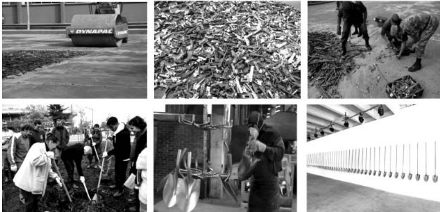
شکل ۶. مراحل اجرای پروژه «اسلحه برای بیل»

ریس ۲ ، هنرمند مکزیکی، از دیگر هنرمندان معاصری است که بیشتر آثارش بر پایه پیکربندی اجتماعی انتقادی شکل می‌گیرد. او سال ۲۰۰۸ اقدام به راه‌اندازی کمپینی با عنوان «اسلحه برای بیل» کرد. این کمپین با حمایت باغ گیاه‌شناسی کولیکان ۳ و مسئولان شهری برگزار شد. در این کمپین، طی فراخوان‌هایی ۱۵۲۷ اسلحه از میان مردم جمع‌آوری و به کارخانه‌ای جهت ذوب و تبدیل به بیلچه‌هایی برای کاشت ۱۵۲۷ درخت منتقل شدند. این بیلچه‌ها طی چهار سال در مؤسسات گوناگون توزیع شدند تا کودکان و بزرگسالان با آن‌ها درخت بکارند. هدف اصلی این پروژه تبدیل سلاح مرگ به سلاح زندگی بود (شکل ۶).