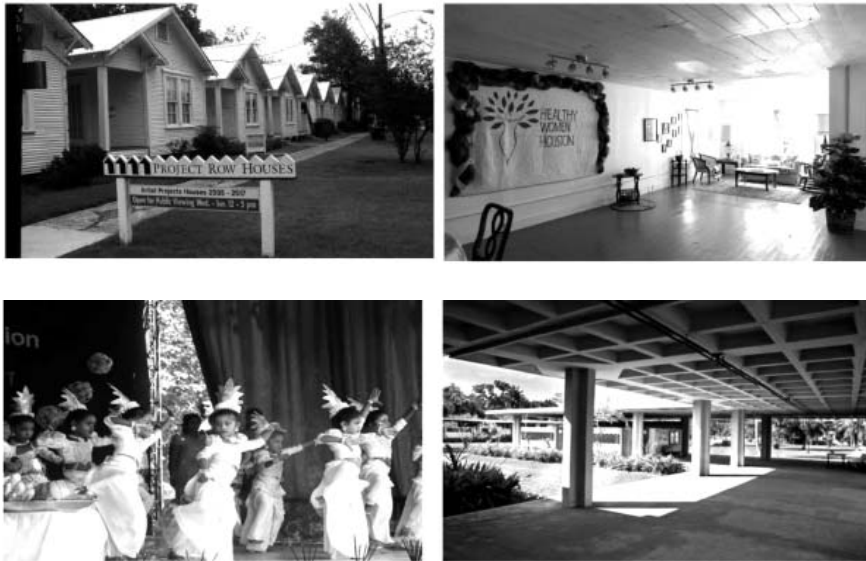
شکل ۳. پروژه «خانه‌های راو»

این پروژه سال ۱۹۹۳ با الهام از آثار بویز پایه‌گذاری شد. گروهی متشکل از هفت هنرمند رنگین‌پوست با رهبری ریک لاو تعداد ۲۲ خانه ردیفی پیوسته و کنار هم را در یکی از محلات شهر هیوستون در ایالت تگزاس خریداری کردند. آن‌ها از ایده بویز، یعنی چگونگی شکل دادن هنرمندان به دنیای اطراف خود، استفاده کردند. اصل بنیادی این هنرمندان تداوم هنر جمعی برای تحول جامعه است. این گروه به کمک ساکنان منطقه شروع به رنگ‌آمیزی و بازسازی خانه‌ها کردند. این پروژه، با تأکید بر هویت فرهنگی و تأثیر آن بر منظر شهری، زندگی را از طریق هنر غنی می‌کند. تعداد این خانه‌ها اکنون به ۳۹ خانه رسیده است. امروزه این خانه‌ها به‌عنوان پایگاه اصلی برای انواع خلاقیت‌ها جهت سازی فرهنگی جامعه با برنامه‌های هنری در نظر گرفته شده است و به‌عنوان هنرمندسرا ۲ به فعالیت خود ادامه می‌دهد. از مهم‌ترین فعالیت‌ها در این خانه‌ها آموزش هنر به کودکان و زنان است (Kimmelman, 2006) (شکل ۳).