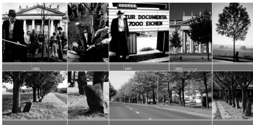
شکل ۱. کاشت ۷۰۰۰ درخت بلوط در شهر کاسل ۱۹۸۲

از نظر بویز، درخت بلوط شروع نمادین زندگی با نگاهی به آرمان‌های گذشتگان بود. در طول سال‌های ساخت این اثر، مشکلات زیادی پیش آمد، از جمله اختلال در رفت‌وآمد شهری، اختلال در کابل‌های برق و شبکه‌های آب، هزینه‌های زیاد اجرای آن و... که پیامد آن اعتراض برخی دولت‌مردان محافظه‌کار و تعدادی از شهروندان بود. اما این پروژه تمام شد و از پس آن هزینه‌ها امروز دیگر درختانی در کاسل رشد کردند که حکم سایبانی را برای این شهر دارند. همان‌طور که درختان و سنگ‌ها اکنون هویتی از شهر هستند، مشارکت توده عظیمی از مردم در ساخت این اثر نیز جزئی جدایی‌ناپذیر از آن است. این اقدام بویز هنر را از استودیوی شخصی بیرون آورد؛ هنر را در سطح جامعه عرضه کرد و از این طریق پیام آموزشی خود را با هنر به مردم انتقال داد. این همان انتقادی بود که به نظام آموزش و پرورش داشت؛ اینکه آموزش و پرورش باید از طریق هنر در جامعه صورت بگیرد. تا آن زمان بسیاری از هنرمندان علاقه‌مند به آموزش از طریق هنر بودند، اما درک تعالیم و افکار بویز پس از مرگ او شروع شد (شکل ۱).