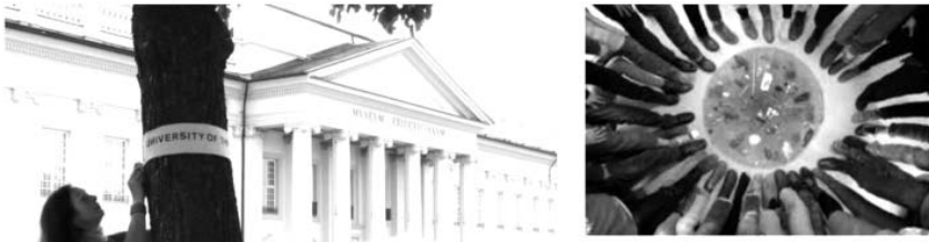
شکل ۲. دانشگاه درختان، کاسل، ۲۰۱۲

«روزی در جنگل ایستاده بودم، ناگهان متوجه شدم که در "دانشگاه" هستم و اگر کسی بتواند در صبر و مهارت شنیدن، دیدن و درک پیشرفت کند، می‌فهمد که همه درختان معلم او هستند.» از نظر او، انسان با درک عملکرد درخت می‌تواند بسیار بیاموزد؛ چراکه درخت سختی‌ها، نور طاقت‌فرسای خورشید، باد و باران و سایر امواج مخرب را از محیط می‌گیرد و آن را به اکسیژن، سرسبزی و طراوت تبدیل می‌کند. ساکس در این سال‌ها به کشف اشکال جدید هنری و ارتباط آن‌ها با تلاش برای جامعه پایدار و مردم‌سالار پرداخته است. او با سازمان‌های فرهنگی و سیاسی زیادی مشارکت دارد و مدیر واحد تحقیقات پیکربندی اجتماعی دانشگاه آکسفورد بروکس است. به اعتقاد ساکس (۲۰۱۵)، پیکربندی اجتماعی یعنی عمل با ابزار رؤیت‌ناپذیر؛ ترکیباتی چون اندیشیدن، گفت‌وگو کردن، انگاشتن. دانشگاه درختان هم‌زمان پروژه هنری، پروژه پیکربندی جامعه و نیز پروژه‌ای زیست‌محیطی است. ایده اولیه آن تلاشی بود در جهت برقراری زمینه‌ای برای کشف، مقابله، بحث و گفت‌وگوی انسان از کردار درونی او تا به رفتار و عمل بیرونی منجر شود (شکل ۲).