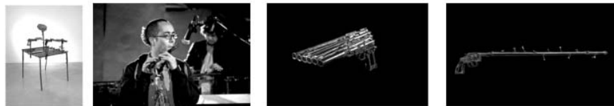
شکل ۷. پروژه «تصور کنید»

به سازهای موسیقی تبدیل کرد. ریس هدف خود را تبدیل آهنگ مرگ به نوای زندگی مطرح کرد (Reyes, 2013). او در این آثار دیدگاه ضدجنگی خود را علناً اعلام کرد. ویژگی‌هایی چون مشارکتی بودن، آفرینش در بستر جامعه، داشتن دیدگاه انتقادی و رویکرد محیط‌زیستی، که جنبه‌هایی از پیکربندی اجتماعی هستند، در آثار ریس دیده می‌شوند (شکل ۷).