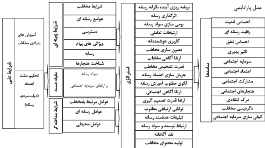
نمودار ۳. مدل پارادایمی

خاستگاه فناوری و رسانه: این مفهوم در دسته «شرایط زمینه‌ای» قرار داده شده است. بدیهی است که ابزار و وسایل برای پاسخ‌گویی به نیازهای انسان تولید می‌شوند؛ هر فناوری در واقع خاستگاهی دارد و اگر فناوری بدون احساس نیاز اولیه و بدون ایجاد تشنگی در مخاطبان به جامعه‌ای عرضه شود، قطعاً کارکردهای مناسبی ندارد یا کمتر دارد. رسانه به‌عنوان یک فناوری از این قاعده مستثنا نیست و خاستگاه رسانه یا شرایط زمینه‌ای جامعه‌ای که در آن رسانه ورود می‌کند رابطه مستقیمی با کارکردهای آن رسانه دارد. به عبارتی، اگر فناوری بدون احساس نیاز اولیه وارد جامعه شود، در خوش‌بینانه‌ترین حالت، به آن فناوری به‌عنوان کالای لوکس یا سرگرم‌کننده نگاه می‌شود و کارکرد اصلی خود را بروز نمی‌دهد. بنابراین، شرایط زمینه‌ای خاستگاه فناوری و رسانه از جهت کارایی بیشتر و مفیدتر حائز اهمیت است.