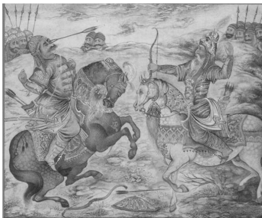
تصویر ۱. نقاشی کشته شدن اسفندیار به دست رستم

اسطوره در روایت شنیداری که شامل موسیقی و گفتار است، بیان می‌شود، مانند اپرای آرفه ۱ ، باله آرفه در دوزخ ۲ و مرارت‌های آرفه ۳ . همچنین اسطوره در روایت دیداری که شامل نقاشی، فیلم، نمایش، مجسمه، عکس و... است، خود را بیان می‌کند، مانند سقوط تیتان‌ها ۴ ، هرکول ۵ ، چهل سرباز ۶ یا حتی به قول رولان بارت تصویری از یک سرباز سیاه‌پوست در حال ادای احترام به پرچم فرانسه ؛ اما هر روایت تصویری اسطوره محسوب نمی‌شود. برای مثال، هر سه تصویر زیر نشانگر فردی هستند که در حال تیراندازی با کمان است؛ اما هر سه تصویر بیانگر روایت دیداری از اسطوره نیستند.