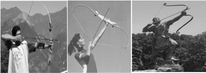
تصویر ۲. معنابخشی به سه تصویر از منظر انتقال فهم اسطوره‌ای

تصاویر شماره دو و سه هر دو ورزشکارانی را نشان می‌دهد که در حال تمرین پرتاب تیر از کمان هستند؛ اما تصویر یک، در محیط فرهنگی ایران، معنایی وسیع‌تر دارد. آرش کمانگیر در بالای کوه (زیر پای تصویر قطعه‌ای از سنگ کوه قرار دارد)، در حال پرتاب تیری است که به واسطه آن مرز میان ایران و توران مشخص می‌شود و او به این واسطه جان خود را نیز از دست می‌دهد. حس وطن‌پرستی و فدا کردن جان در برابر حفظ مهین، یکی از پیام‌هایی است که در پس اسطوره آرش کمانگیر نهفته است. برای کسی که از روایت آرش کمانگیر اطلاع دارد، تصویر یک با تصویرهای دیگر تفاوت پیدا می‌کند و گرنه تنها تفاوتشان در تصویر انسان و مجسمه بودن خواهد بود و روایتی را نقل نمی‌کنند.