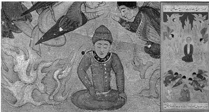
تصویر ۱۰. سجده فرشتگان بر حضرت آدم و روگردانی ابلیس از این واقعه، نفحات الانس، ۱۰۶۰ ه.ق، بخارا.