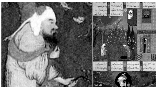
تصویر ۱۲. کشته شدن مرداس توسط ضحاک به تحریک ابلیس، شاهنامه طهماسبی، ۹۴۶-۹۲۸ ه.ق، تبریز.