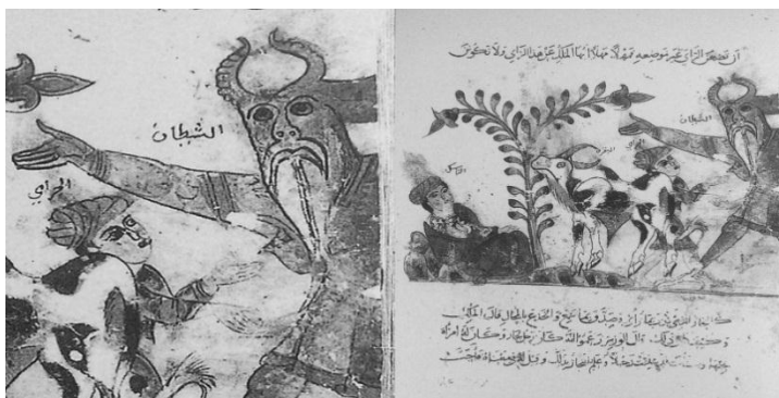
تصویر ۵. مواجهه شیطان با مرد دین‌دار، کلیله و دمنه، سده هفتم ه.ق، سوریه.