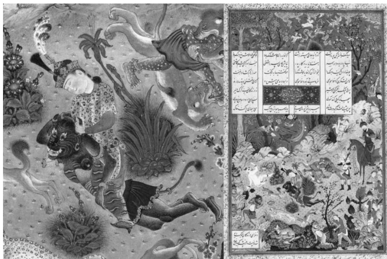
تصویر ۱. نبرد هوشنگ با خروزان دیو (پور اهریمن)، شاهنامه طهماسبی، ۹۴۶-۹۲۸ ه.ق، تبریز.

در نگارگری ایرانی، به‌ویژه در نگاره‌های سده دهم هجری، یکی دیگر از راه‌های تمایز بخشی به شیاطینی که پیکره‌های انسانی دارند، پوشاندن لباس متمایز بر تن آنهاست. نمود اصلی این تغییر لباس، بیشتر در کلاه‌های غیر متعارفی که بر سر پیکره‌هاست بروز پیدا کرده است. کلاه‌هایی که با پوشش سر دیگر افراد نگاره متفاوت است. ظاهراً این کلاه‌ها متعلق به پوشش و لباس اقوام و ملل دیگری غیر از ایرانیان بوده است. اقوامی که می‌توانند هندی، آفریقایی یا اروپایی باشند. این وضعیت تا حدی با تیره ترسیم کردن پوست بعضی از شیاطین نیز شباهت دارد. در هر دوی این موارد نگارگر سعی کرده تا شیطان را بیگانه نشان بدهد. نمونه حاضر علاوه بر بهره‌گیری از کلاه نامتعارف، پوستی تیره‌تر از دیگر افراد حاضر در نگاره را نیز برای او در نظر گرفته است. همین امر موجب تمایز کامل او با تعداد بسیار زیاد پیکره‌های موجود در نگاره شده است (تصویر ۱۵).