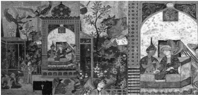
تصویر ۹. حضور جمشید در سرای جنیان، مثنوی جمشید و خورشید سلمان ساوجی، ۹۵۴ ه.ق.