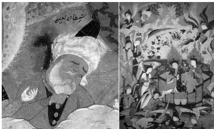
تصویر ۱۴. سجده فرشتگان بر آدم و حوا، فالنامه جعفری، ۹۵۷ ه.ق، تبریز یا قزوین.