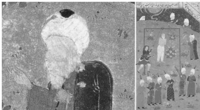
تصویر ۱۳. سخن گفتن ابلیس با برصیصا، کلیات سعدی، سده دهم هجری، بی جا و بی تا.