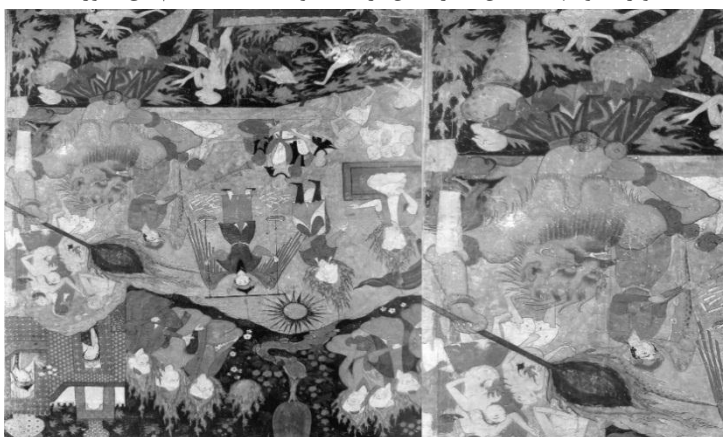
تصویر ۶. روز داوری، نسخه احتمالی از یک فالنامه، ۹۵۷ ه.ق، قزوین.