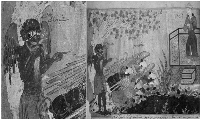
تصویر ۴. تمرد ابلیس از سجده بر آدم، تاریخ طبری، ۸۱۹ ه.ق، هرات.