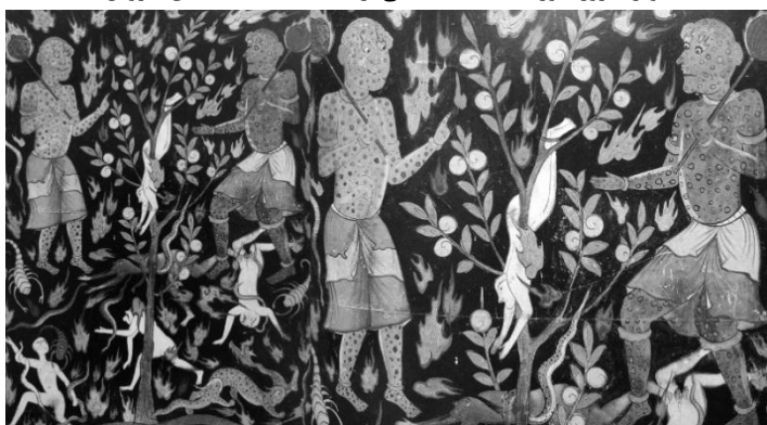
تصویر ۷. جهنم، فالنامه‌ای متعلق به دوره صفوی، احتمالاً سده یازدهم هجری قمری و غرب ایران.