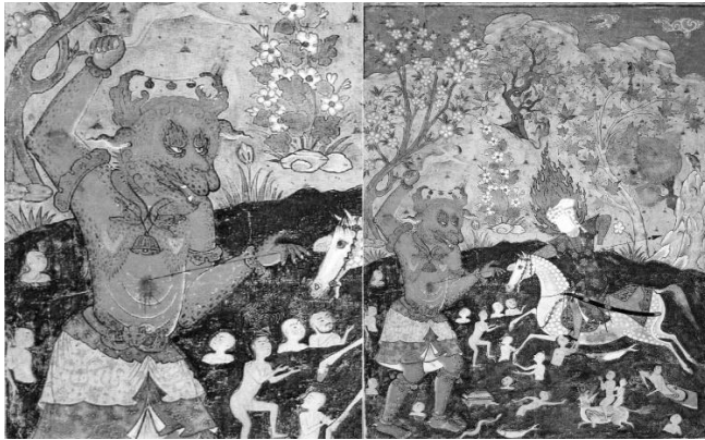
تصویر ۳. نبرد امام رضا (ع) با دیو، فالنامه جعفری، ۹۸۴ ه.ق، احتمالاً قزوین.