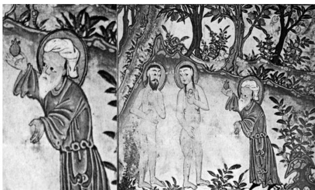
تصویر ۱۱. آدم و حوا، آثارالباقیه، ۷۰۷-۷۰۵ ه.ق، تبریز.