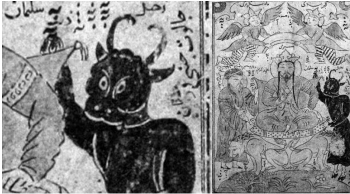
تصویر ۸. جالوت جنی در حضور حضرت سلیمان و آصف بن برخیا، برگی از یک کتاب نامعلوم، دوره ایلخانی، غرب ایران.