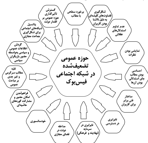
نمودار شماره ۲: مدل حوزه عمومی تضعیف‌شده در شبکه اجتماعی فیس‌بوک

ادامه‌دار نبودن مسائل مطرح‌شده، غلبه جلوه بر ایده، جنبه سرگرم‌کننده بودن مطالب، خصلت انتقادی نبودن مطالب و مسائلی از این دست تضعیف می‌شود. در واقع این یافته‌ها برخلاف یافته‌های سید علوی و نقیب‌السادات (۱۳۹۱) است که نشان می‌داد وبلاگ‌ها و شبکه‌های اجتماعی از مصادیق حوزه عمومی در فضای مجازی هستند. همچنین در یافته‌های این پژوهش از سویی در تطابق با یافته‌های یزدخواستی و دیگران (۱۳۹۲) است که نشان می‌داد هرچند شبکه‌های اجتماعی امکان گفت‌وگو را ارتقاء می‌دهند ولی محدود و مغشوش کننده آن هم هستند ولی از سوی دیگر بر خلاف یافته‌های تحقیق این پژوهشگران؛ که محدودیت مورد نظر را ناشی از توزیع نابرابر این‌گونه فناوری‌ها می‌دانست، تحقیق حاضر این محدودیت‌ها را علاوه‌بر اینکه ناشی از نابرابری در توزیع امکان‌های مرتبط با این فناوری می‌داند، همچنین نابرابری در مناسبات میان کاربران و تفاوت در سرمایه (... را به‌عنوان محدودیت‌های اصلی پیش‌روی شکل‌گیری گفت‌وگوی آزاد و برابر قلمداد می‌کند.