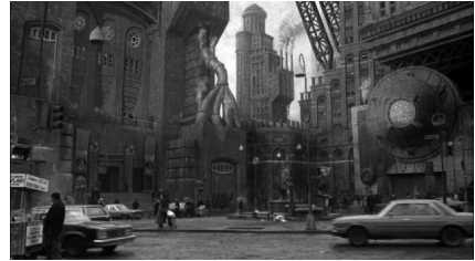
تصویر ۹. بتمن (۱۹۸۹).