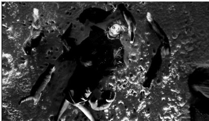
تصویر ۱۲. بتمن بازمی‌گردد (۱۹۹۲).