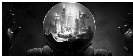
تصویر ۱۹. اسپایدرمن: دور از خانه (۲۰۱۹).