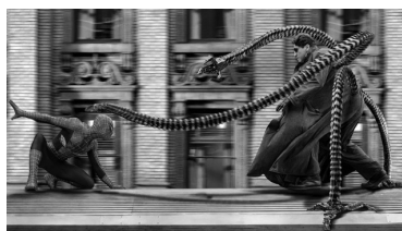
تصویر ۱۵. اسپایدرمن ۲ (۲۰۰۴).