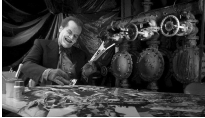
تصویر ۱۰. بتمن (۱۹۸۹).

در قسمت دوم فیلم: بتمن بازمی‌گردد (۱۹۹۲)، اسطوره‌زدایی در تشابه و تضاد قهرمان با سه شرور، خصلت التقاطی پیچیده‌تری یافته و حضور وی را تحت‌الشعاع قرار داده است. «آیا آرزوهای ساده‌لوحانه اسطوره قهرمانی در جهان فیلم‌نوآر و سیاهی که احاطه‌اش کرده، جایگاهی دارد؟» (دی پائولو، ۱۴۰۰: ۱۵۳). آنارشیسیم پنگوئن ناقص‌الخلقه، سلطه‌جویی شریک سرمایه‌دار و فمینیسم‌کت‌وومن عقده‌مند از تحقیر زنان، به ترتیب با یتیمی و انتقام‌جویی، فئودالیسم و وابستگی به شهر و همدلی با فرهنگ پاپ در شخصیت بروس در اشتراک‌اند. برتون در تشابه با علائق بنیامین به کتاب‌های مصور کودکان، حال‌وهوایی کریسمسی را در تضاد با اقدامات شرورانه فیلم، تدارک دیده است.