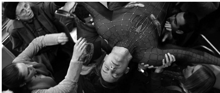
تصویر ۱۷. اسپایدرمن ۲ (۲۰۰۴).

اما این همدردی پیتر با مردم است که قدرت‌هایش را به وی بازمی‌گرداند. سکانس تأثیرگذار نجات قطار هوایی، فراتر از جلوه‌های ویژه، نشان می‌دهد که دعای خیر مردم، بدرقه اسپایدرمن است. او در آسیب‌پذیرترین شکل و با نقاب افتاده،