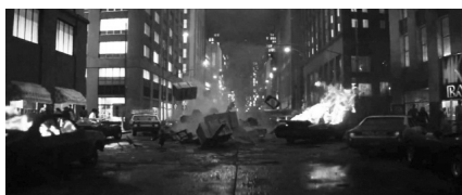
تصویر ۶. سوپرمن (۱۹۸۰).