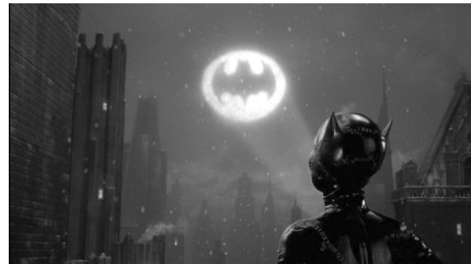
تصویر ۱۱. بتمن بازمی‌گردد (۱۹۹۲).

مؤثرترین شرور- درواقع ضدقهرمان- فیلم، کت‌وومن است، با نام اصلی سلنا کایل ۱ منشی قدرنادیده شرک که هراس ادیپی بتمن نسبت به زنان را به شکلی از اعتراض فمینیستی بروز داده و بروس را به‌رغم آزرده‌گی از خصلت‌های آنارشیسیتی‌اش، مجذوب ساخته است. فیلم قصد القای این پیام را دارد که نه پنگوئن و نه بتمن- هر