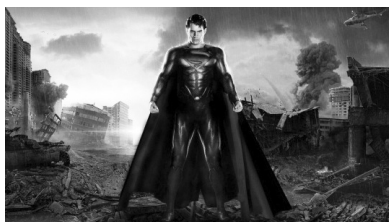
تصویر ۸. سوپرمن بازمی‌گردد (۲۰۰۶).