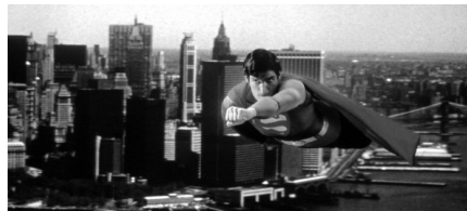
تصویر ۱. سوپرمن (۱۹۷۸).