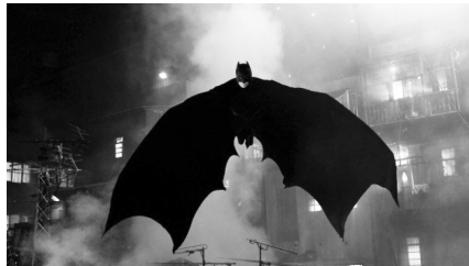
تصویر ۱۳. بتمن آغاز می‌کند (۲۰۰۵).

در هزاره جدید، کریستوفر نولان در گذر از بازتاب‌های اجتماعی - سیاسی یازده سپتامبر، سه‌گانه بتمن خود را در سبک تریلرهای شهری و به دور از جنبه‌های فانتزی کمیک، به تصویر درمی‌آورد تا اسطوره‌زدایی را با آسیب‌پذیری حداکثر، به حماسه نزدیک کند. در بتمن آغاز می‌کند (۲۰۰۵)، بروس برای غلبه بر ترس‌ها و آمادگی برای مبارزه و انتقام، زیر نظر هانری داکار ۱ ، به‌مثابه پدری جایگزین، در خاور دور آموزش رزمی می‌بیند. فیلم، ترس را با مفهوم ارسطویی تئاتر، ترکیب می‌کند تا مسیر تحول قهرمانش را بازگو نماید. جایگزینی نمایش رزمی شرقی به جای نمایش اپرایی - و نخبه‌گرای - غربی، جایی که بروس و والدینش در شب سوءقصد به آنجا رفته بودند، می‌تواند به غلبه خشم بر ترس تعبیر شود. این جادوی سینما، رسانه برابر طلب و به قول بنیامین، «روشن‌کننده امکان دگرگونی کامل زندگی اجتماعی» (همان، ۲۴۲)، است که ترس و انتقام‌جویی را به نفع اقدامات عدالت‌جویانه، کنار می‌زند.