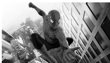
تصویر ۱۶. اسپایدرمن (۲۰۰۲). منبع: www.scomics2film.com

اسپایدرمن ۲ (۲۰۰۴)، یک کم‌دی سیاه‌غناپی با محوریت شکست‌های مادی و عاطفی پیتر پارکر و از دست رفتن نمادین قدرت‌های وی است. فیلم، اسطوره‌زدایی را با گرایش ابرقهرمان به یک زندگی عادی بی‌دردسر ولی سلطه‌پذیر، روایت می‌کند. پیتر برای جبران مشکلات درسی‌اش، با دانشمندی به نام دکتر اوتو اوکتاویوس رفیق می‌شود که تحت حمایت آژکورپ، دستگاهی متشکل از چهار بازوی بلند متصل به سیستم عصبی اختراع کرده که مثل خورشید، انرژی سالم در بدن ایجاد می‌نماید؛ اما زمان زیادی سپری نمی‌شود که اوکتاویوس، با اشاره به بیهوشی تی. اس. الیوت، شاعر و نویسنده نقاد مدرنیته، قربانی اشتباهات محاسباتی خودش شده و به شروری با بازوهای موج‌ویرانگر- اوکتاویوس مترادف لاتین اختاپوس است- بدل می‌گردد. هیولایی قابل ترحم- تداعی ضحاک یا نرون- که زاینده علم و سرمایه‌داری و ویران‌کننده جامعه مدرن است.