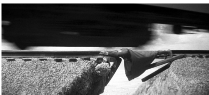
تصویر ۴. سوپرمن (۱۹۷۸).