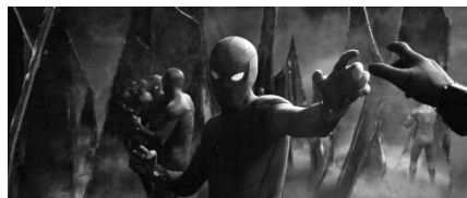
تصویر ۱۸. اسپایدرمن: دور از خانه (۲۰۱۹). منبع: فیلم اصلی

در اسپایدرمن: راهی به خانه نیست (۲۰۲۱)، اظهارات ویدئویی کوئنتین، باعث بدنامی اسپایدرمن و لو رفتن هویت واقعی‌اش می‌گردد و او این بار به فلسفه واقعی جهان‌های موازی زیر نظر دکتر استرنج، ابرقهرمان دیگر مارول، پناه می‌برد تا هویت پیتر پارکر را از اذهان پاک کند. این امر به خطرناک‌ترین آزمون زندگی اسپایدرمن منتهی می‌شود: بازگشت اشرار فیلم‌های قبلی، از دست رفتن دردناک زن عمومیش، فراموش شدن در ذهن نزدیکان و تنهایی ابدی او که تعلق جاودانه‌اش را به مردم و شهر به ارمغان می‌آورد.