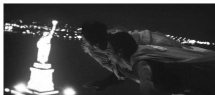
تصویر ۳. سوپرمن (۱۹۷۸). منبع: فیلم اصلی

درعوض، دشت‌های طلایی و آسمان آبی کانزاس، به تصور ما از بهشت نزدیک‌تر است و متروپولیس فیلم با غلبه طنز بر حماسه، تجلی آرمانشهری است که بنیامین معتقد به ظهور منجی موعود، به منزله باوری دینی، طرح کرد. ذات اسطوره، به هر دو جهان تعلق دارد: بلور کریپتونیت - همزمان راهنما و نابودگر - مسیر ابرقهرمان را مشخص می‌کند و لوئیس لین، همکار پرشور شور کلازک، تجسم عشق او به انسان‌ها و رسانه‌های شهری است. سکانس شاعرانه پرواز دونفره بر فراز متروپولیس - با تمام نشانه‌های توریستی نیویورک - نقطه اوج عشق آن‌ها و یادآور دیدگاه بنیامین و بودلر از افسون نورهای مصنوعی شهرهای مدرن است. در پایان سوپرمن جان میلیون‌ها انسان را نجات می‌دهد و لوتور را تحویل پلیس می‌دهد، اما به موقع به معرکه‌ای که لوئیس در آن گرفتار شده، نمی‌رسد. او با دخالت در روند تاریخ، نجات عشق زمینی را بر مسئولیت آسمانی مقدم می‌شمارد که شروعی بر وسوسه رابطه جسمانی، مضمون مرکزی قسمت بعدی است.