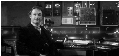
تصویر ۲. سوپرمن (۱۹۷۸).

بنیامین: «تخریب همگانی سنت برای راه یافتن قهرمانان آسمانی و اسطوره‌ها به زندگی توده مردم» (طهوری، ۱۳۸۴: ۶۸)، به تصویر درآید.